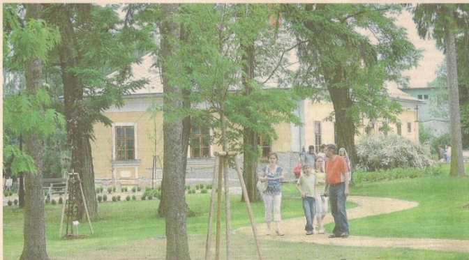
RAČTE VSTUPOUIT. Slavnostní otevření zámekového parku na Skaličce si nenechaly ujít davy lidí.

„Majitelé z toho měli zpočátku obavy, protože kácení je nevratný krok, ale zelen v parku byla za desítky let velmi zanedbána. Při dosahové jsme se snažili ji oživit zajímavými kultivary, jako je například platan, cedr nebo ginkgo biloba,“ říká autorka projektu, zahradní architektka Jana