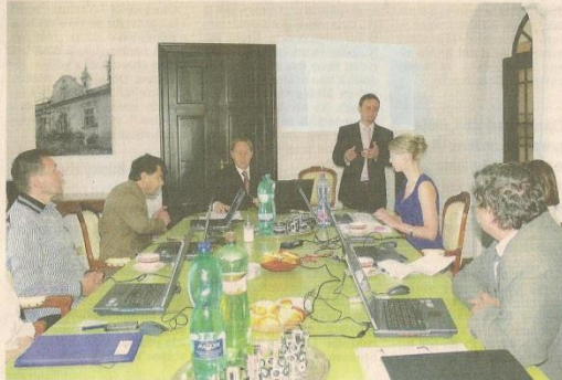
RADÍ SE NA ZÁMKU. Zasedání městské rady se konalo včera v největší reprezentační místnosti zámku na Skaličce.

„Takové velké akce chystáme jednou až dvakrát do roka, ale zároveň chystáme seriál léto na zámku. Památka bude otevřena k prohlídce od května až do září každou neděli vždy od čtrnácti do devatenácti hodin, kdy tady bude fungovat také kavárna.